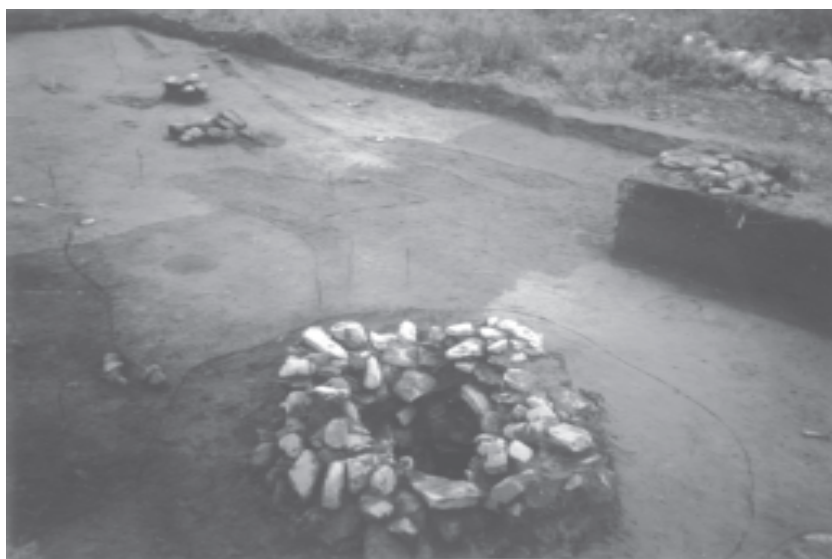
Рис. 3. Колодец Краскинского городища.

этот раз он был сложен в верхней части и снаружи галечниковой насыпью. Видимо, во время надстройки появилась необходимость отвода накопившейся в низине у вала воды. Для этого в старых блочных стенах был сооружен специальный тоннельный водоотвод из больших каменных плит (возможно, взятых из разрушенной стены). Первоначальная конструкция городской стены имеет самые прямые аналогии на бохайских городищах в Приморье и в Маньчжурии. Такая же конструкция вала наблюдается на когуреских городищах. Интересно отметить, что северная и южная части внутренней каменной стены в раскопе отличаются породой используемого камня и общим видом кладки. Это может свидетельствовать о том, что различные участки стены строились разными коллективами, самостоятельно добывавшими камень для строительства.