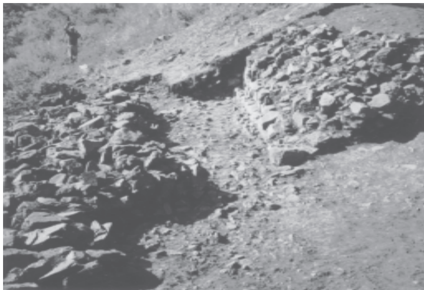
Рис. 6. Ворота городища Синельниково.

высоты 1,5 м, и конструкция его была усложнена. Внешняя стена была сложена из каменных блоков, а внутренняя представляла собой деревянный частокол. Пространство между стенами заполнено землей. Ширина основания вала — 3 м, ширина вершины — до 1 м. Судя по материалам из раскопа, более древний вал был отсыпан мохэсцами, а поздний — бохайцами. Археологический материал и стратиграфическая ситуация позволяют предварительно отнести памятник к VI — VIII вв. Очевидно, городище служило временным убежищем для местного населения в период военных столкновений и в то же время являлось сторожевым пунктом. Находки из раскопов представлены мохэской и бохайской керамикой, железными наконечниками стрел, точильцами, костяными поделками и др.