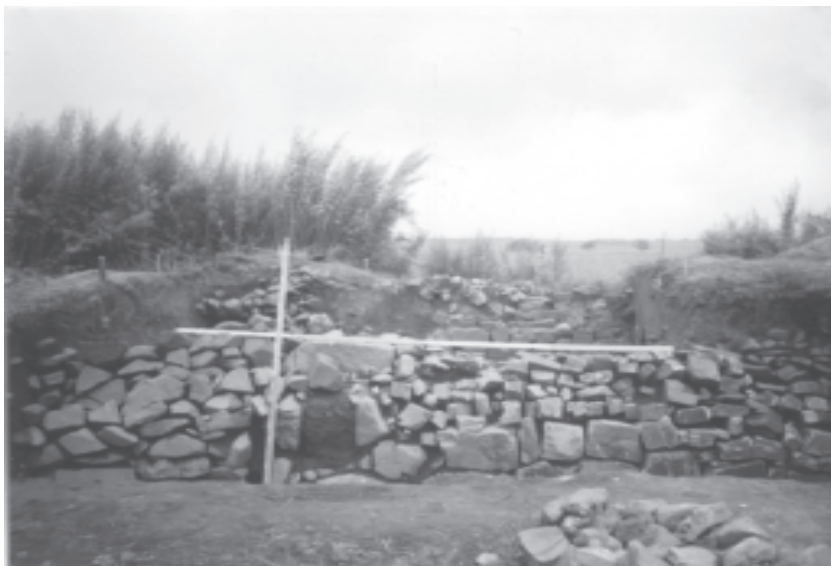
Рис. 4. Городская стена Краскинского городища.

На городище впервые обнаружена бронзовая танская монета Кай-юань тунбао, датируемая VIII в. — очень редкая для бохайских памятников находка. Из других находок следует отметить фрагмент сосуда с иероглифической надписью, железный ключ и наконечник стрелы, фрагменты орнаментированной черепицы.