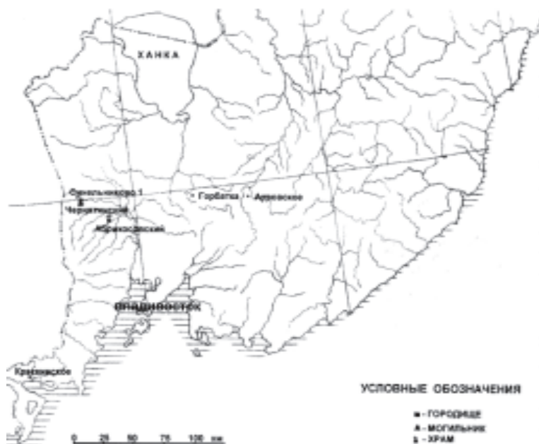
Рис. 1. Карта археологических памятников эпохи Бохая, исследованных в 1997 г.

печи находились яма с глиной — сырьем для изготовления черепицы и большое скопление бракованной черепицы.