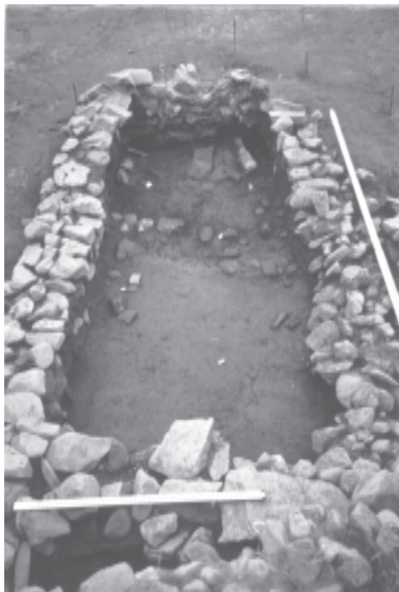
Рис. 2. Печь Краскинского городища.

этот раз он был сложен в верхней части и снаружи галечниковой насыпью. Видимо, во время надстройки появилась необходимость отвода накопившейся в низине у вала воды. Для этого в старых блочных стенах был сооружен специальный тоннельный водоотвод из больших каменных плит (возможно, взятых из разрушенной стены). Первоначальная конструкция городской стены имеет самые прямые аналогии на бохайских городищах в Приморье и в Маньчжурии. Такая же конструкция вала наблюдается на когуреских городищах. Интересно отметить, что северная и южная части внутренней каменной стены в раскопе отличаются породой используемого камня и общим видом кладки. Это может свидетельствовать о том, что различные участки стены строились разными коллективами, самостоятельно добывавшими камень для строительства.