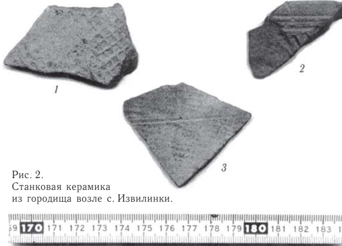
Рис. 2. Станковая керамика из городища возле с. Извилинки.

Посуда с отпечатками следов колотушки уже встречалась в Приморье на некоторых средневековых памятниках. Так, подобная керамика найдена в нижней части слоя на чжурчжэньском Осиновском поселении 1 , а также в