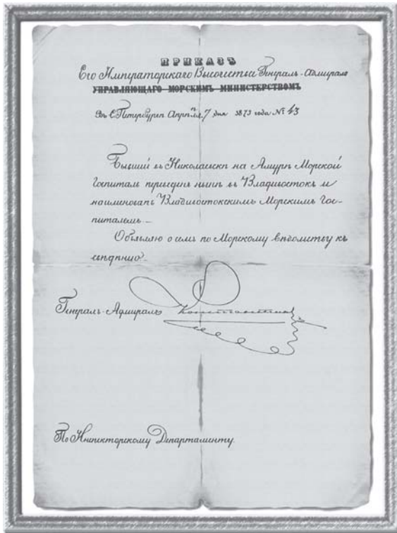
Приказ Великого князя Константина, 1873 г.