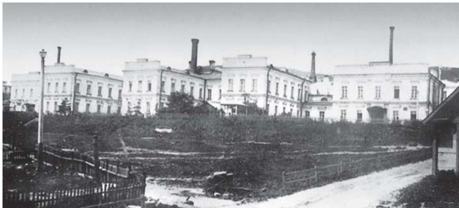
Владивостокский морской госпиталь, начало XX в.