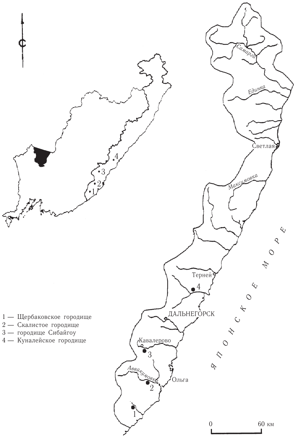
Рис. 1. Схема расположения больших горных городищ на востоке и северо-востоке Приморского края.