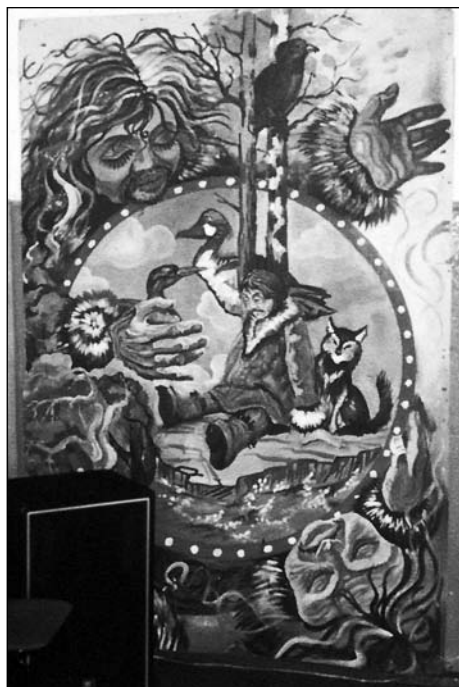
Человек и Боги

В верхнем мире находится солнце дэлэча , месяц бега , звезды игакак-тал — «блестящие». Главным в верхнем и среднем мире считается добрый Бог Сэвэки антропоморфного облика с седой бородой, в нижнем мире — злой Бог Аваги или Хэргу — страшное, лохматое, черное существо. Бог Сэвэки не пускает его в верхний мир. Но злой Бог может самостоятельно проникнуть в средний и подводный миры. На основе этого верования некоторые старики-эвенки никогда не ловили и не употребляли в пищу налимов и шук, считая их «чертовыми» рыбами. Эвенки верили, что в старых, заброшенных поселениях галагда обитают злые духи. Таким же термином называли не только проклятые места, но и, например, женщин, у которых часто погибали мужья, человека, которого задрал медведь. Верования о помеченном медведем человеке галигда характерны в настоящее время для амгуньских негидальцев и горинских нанайцев 5 .