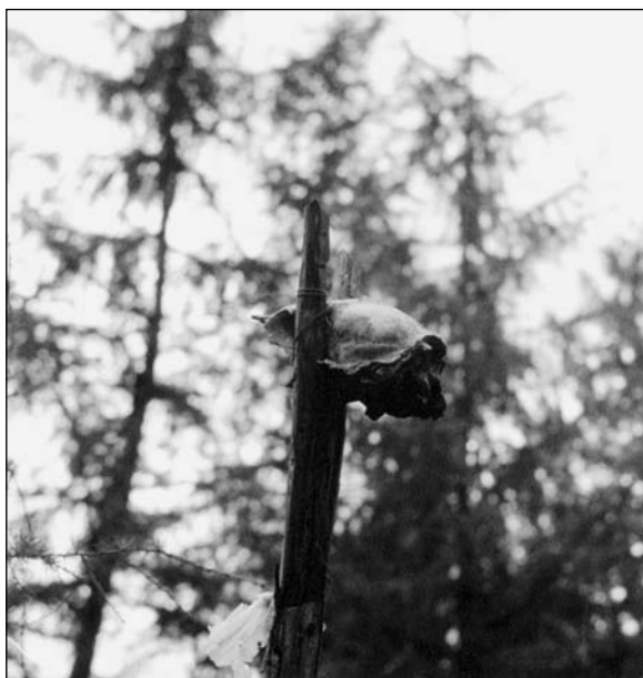
Медвежий череп — охранитель стоянки

православных крестов. В настоящее время творческая интеллигенция села устраивает христианские праздники, на которые приезжают священники из Благовещенска и крестят детей.