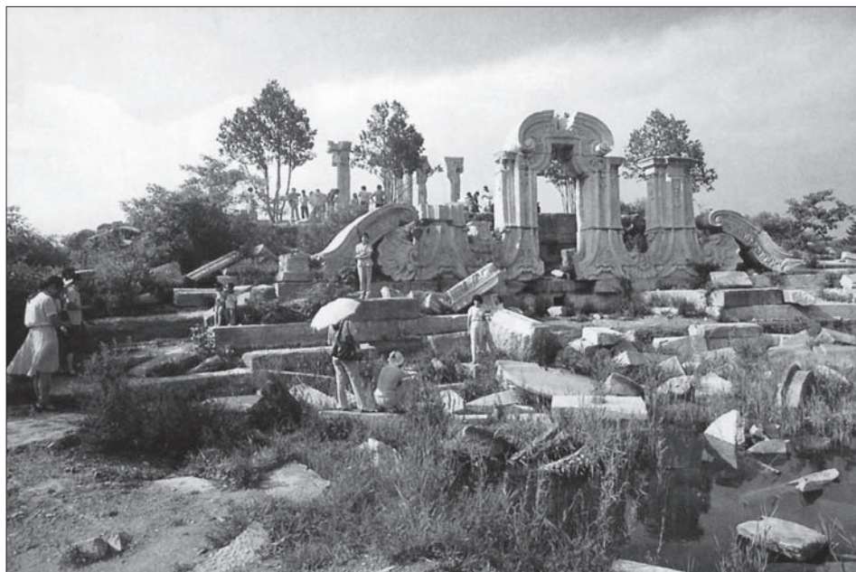
Рис. 1. Развалины императорского дворца Юаньминъюань в Пекине.

В 1988 г. Сюй Тайлай предложил считать в качестве основного ключевого понятия новой истории Китая капиталистическую модернизацию. Он считает, что это понятие включает и антиимпериалистическую, и антифеодальную борьбу, и развитие капитализма. На этом основании он предложил обозначить время новой истории Китая с 1840 по 1949 г.