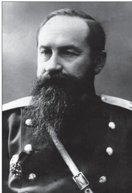
Военный инженер генерал-майор А.П. Шошин.

была неперменным атрибутом тогдашнего летнего женского костюма. Дополнительный аргумент для датировки фотографии декабрем 1911 г. предоставил известный Владивостокский краевед и историк Алексей Михайлович Буюков, определивший представительного полковника, сидящего в центре в первом ряду, как военного губернатора Приморской области И.Н. Свечина. Указ о назначении нового губернатора был подписан в первой половине 1911 г., и предположение, что И.Н. Свечин оставался во Владивостоке до лета 1912 г. представляется неожиданным.