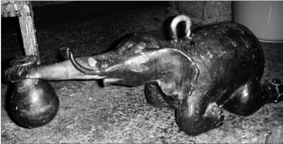
Рис. 3. Бронзовая фигурка слона. Храм шествующего ангела. Бангкок, Таиланд, 2006 г.

Желающий узнать ответ на интересующий его вопрос должен сконцентрироваться, очистить сознание от посторонних мыслей, помолиться, как умеет, и быть готовым смиренно узнать от слона волю духов. Для этого нужно сесть в позу почтительного приветствия, вытянуть вперед руку, вставить мизинец в кольцо на спине слона и попытаться поднять его. Вес бронзовой фигуры оракула равен приблизительно 5–6 кг. Причем мужчины поднимают слона мизинцем левой руки. Женщины делают то же самое, только мизинцем правой руки. На один вопрос дается одна попытка, не допускается никаких раскачиваний и поддержаний локтя.