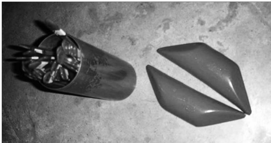
Рис. 2. Оракул «инь-ян» и пронумерованные палочки для гадания «сиамси». Храм шестяущего ангела. Бангкок, Таиланд, 2006 г.

В Таиланде слон считается священным животным. Тайцы верят, что слон может предсказывать будущее. Во многих храмах около алтаря можно увидеть фигурку бронзового слона с кольцом на спине (рис. 3). Именно он и играет роль мудрого и справедливого оракула.