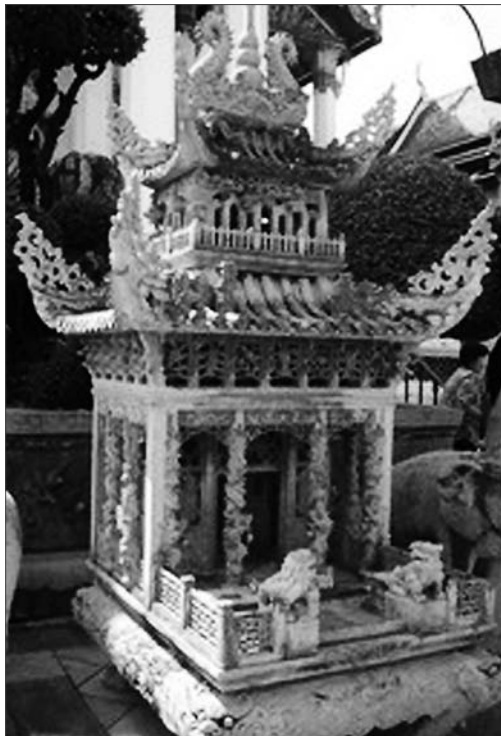
Рис. 4. Старинный домик духов с почтением передан на хранение в Храм утренней зари Ват-Арун. Бангкок, Таиланд, 2006 г.

При переезде в новый дом или офис, знаменующем повышение социального статуса, владельцы могут приобрести новый, большой и красивый домик для духов, а старый с почтением переносят в храм. Домики духов продаются на специальных улицах. Дизайн обители духов, варьируясь от простой лакированной модели до фантастически украшенного позолотой, искусной резьбой и цветным стеклом шедевра миниатюрного зодчества,