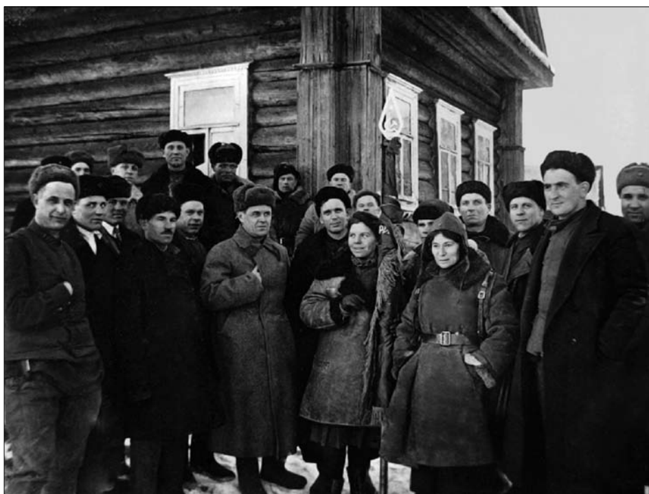
Делегация приморцев на Ленинградском фронте [1941—1945 гг.]