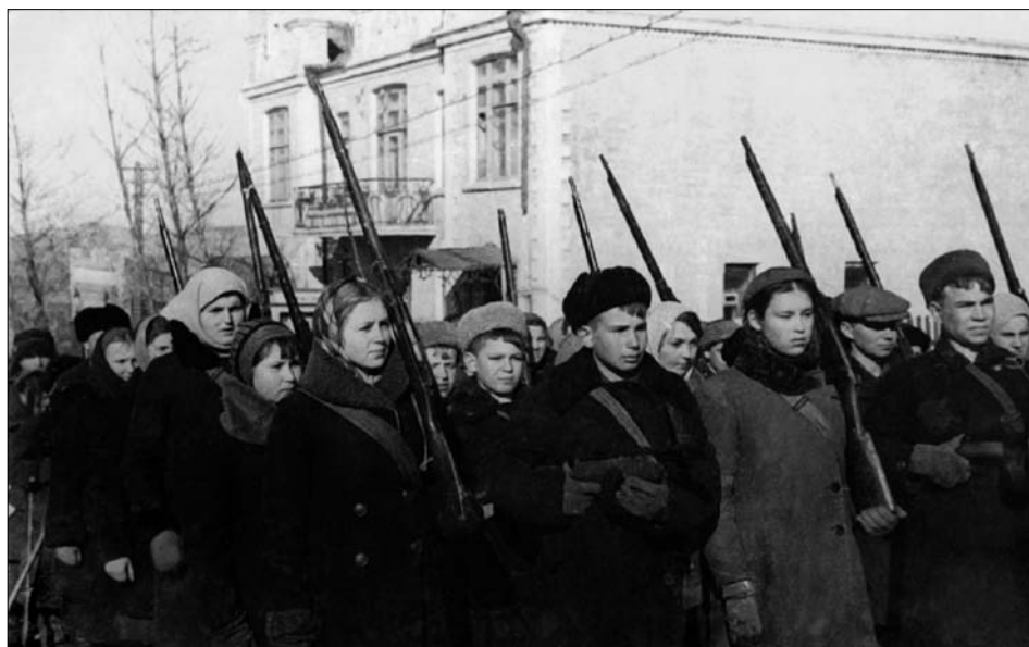
Школьники Владивостока на строевых занятиях 1943 г.