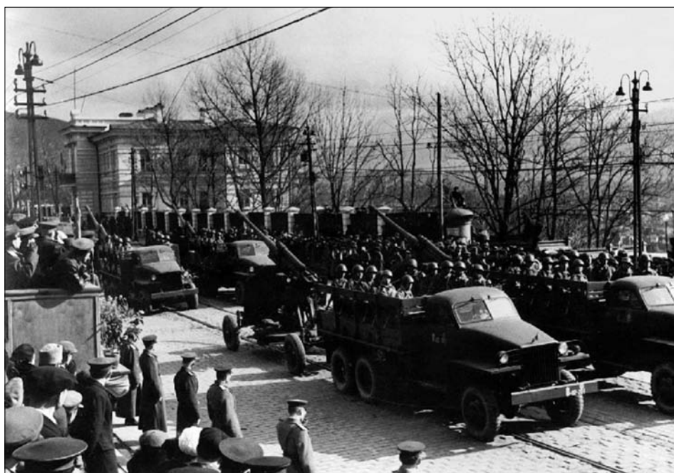
Парад в День Победы в городе Владивостоке. Колонна артиллерии 1945 г.