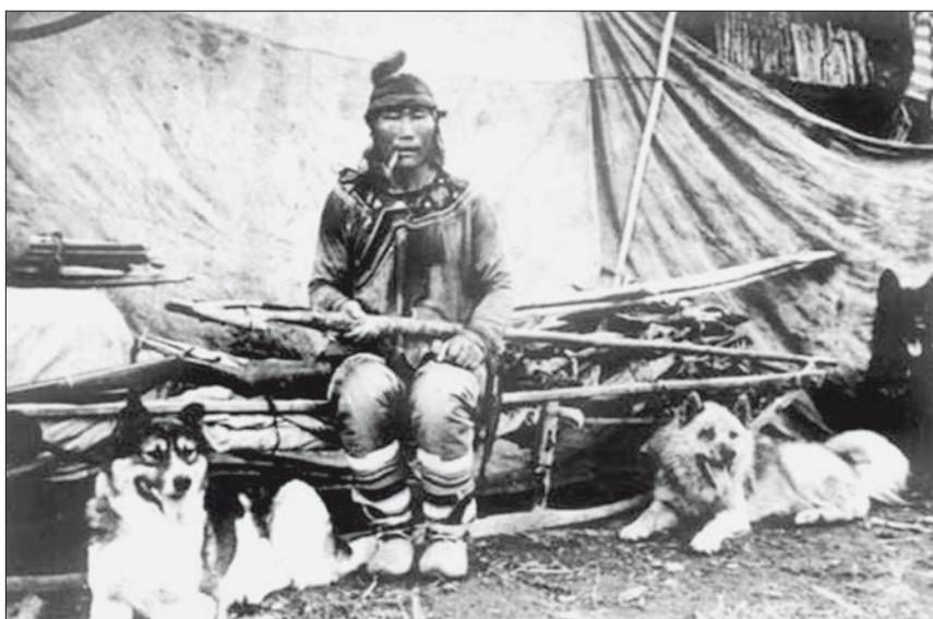
Рис. 1. Удэгеец с собаками. Ф. 4928213. МПК № 14638—30. № 59

Одним из важнейших видов охотничьего промысла с собакой являлась добыча пушного зверя. Существовавшая с давних времён торговля