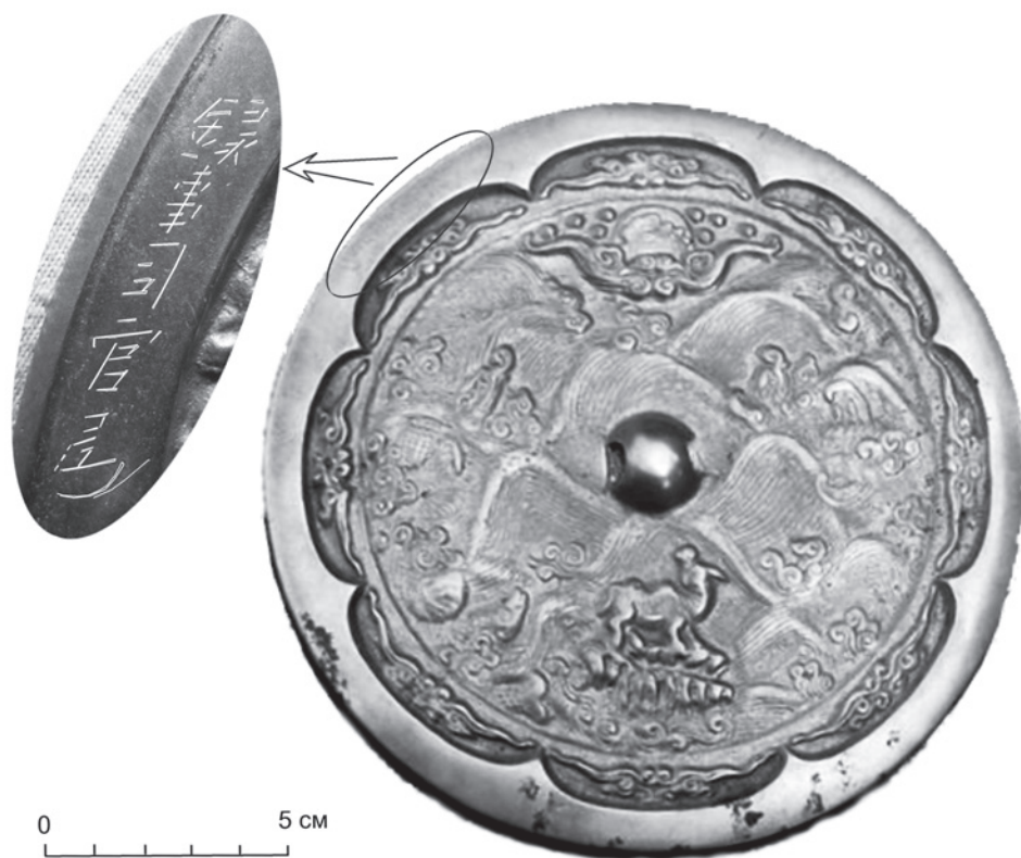
Рис. 2. Бронзовое зеркало и надпись на нём