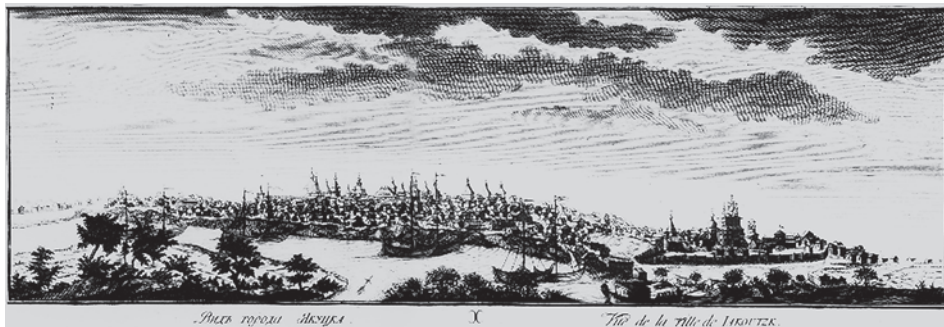
Рис. 1. Вид города Якутска: справа Спасский монастырь. С гравюры XVIII в.

света. Воплощённая практически без отклонений, благодаря равнинному северному рельефу, идеальная топологическая модель задавала позиции расположения храмовых объектов в пространственной структуре Якутского Спасского монастыря. Так, поскольку Якутскому архитектурному ансамблю изначально была свойственна организация внутренней среды по принципу симметрии, обусловленной направлением главных планировочно-композиционных осей, закономерно, что точку их пересечения зафиксировала деревянная ярусная доминанта колокольни — вертикальный акцент, дополнивший изначально двухчастное идейно-духовное ядро старых храмов, перенесённых с прежних мест, — Михайловской церкви и Спасского собора. Михайловская церковь была поставлена восьмериком на четверике, с трёх сторон охваченном гульбищем. Восьмерик основного храмового объёма завершался массивным шатром; западный и восточный прирубы (притвора и апсиды соответственно) — бочкообразными крышами, несущими луковичные главы на изящных тонких барабанах.